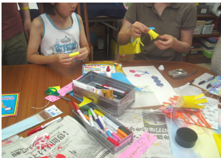
七夕の願い事は芸事がいいらしいよ。

7月7日は七夕、みんなで短冊をさげる竹の調達のため、のこぎりを持って渡辺家へ行きました。小さい子から順番に切っていきます。慣れないのこぎりも案外楽しそう。中からまっぶたつに割れたかぐや姫がでてる、なんてこともなく、教会に運びました。教会についたら飾り付け。短冊のほかにも、ちょうちんとかお花とか、思い思いの飾りを作りました。