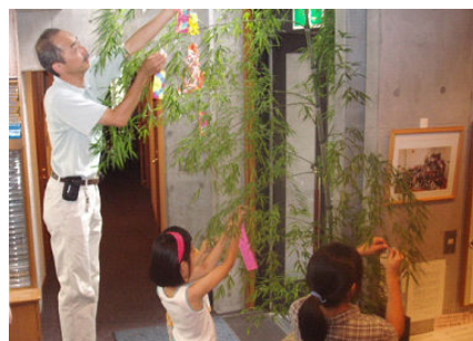
進先生は脚立に乗ってるので、背が高い